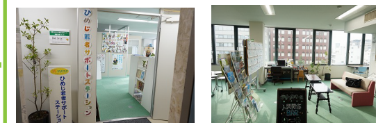
エレベーターを降りた入り口

ひめじ若者サポステは大手前通りハトヤ第一ビルに引っ越しました！新しい事務所に是非お越し下さいね