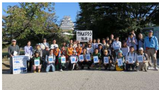
第313回 お城のそうじ <H.29.10.8>