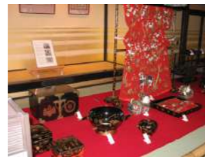
「お姫様道具」 櫻の間にて公開

記念イベントを開催致します。 お姫様の道具などの寺宝内覧会、姫路BORO市、 雅楽演奏会などを開催します。