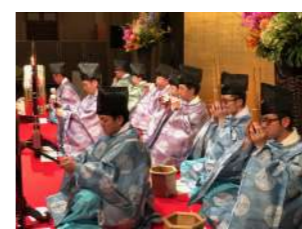
「雅楽演奏会」 11:00～ 本堂前 真宗文化研究会雅楽部 楽楽会